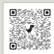
空き家購入等補助