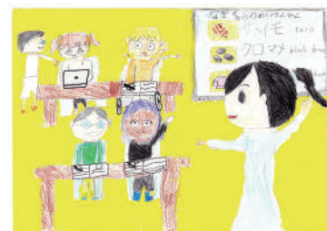
33. わたしのゆめ~だれでもまなべてだれでも おしえられる学校をつくる~(小学校1年生)