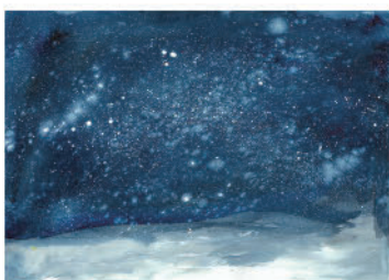
29. 雪がふっている 大人になってもなごちよ うに雪がふってほしい!! (小学校3年生)