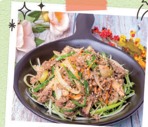
韓国の代表料理 「プルゴギ」

今回の国際料理教室では、韓国人が一番好きな肉料理「プルゴギ」を一緒に作ってみましょう!