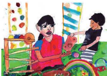
34. 子どもえんの先生になった私 (小学校2年生)