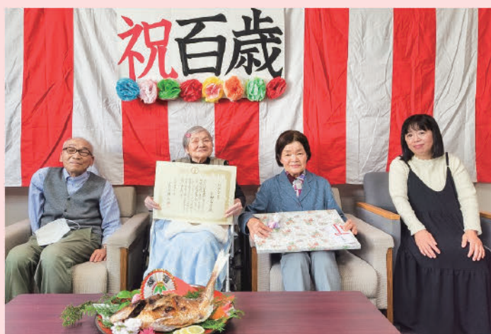
図 こども・長寿課 ☎36-6700

現在は施設で生活され、職員の皆さんや施設内の仲間と交流を楽しみながら、とても明るく、穏やかに過ごしておられます。また長生きの秘訣は「くよくよしないこと」だそうです。この日もお元気で、楽しそうにお話しされながら、周囲を温かい笑顔で包み込んでくださいました。