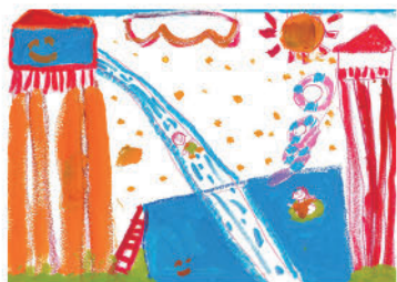
18. あつらしいな あそぶ所がたくさん ある奈義町 (小学校2年生)