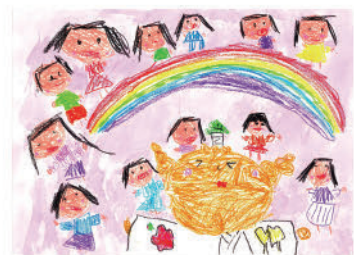
35. なぎつ子 いっぱい (5才)