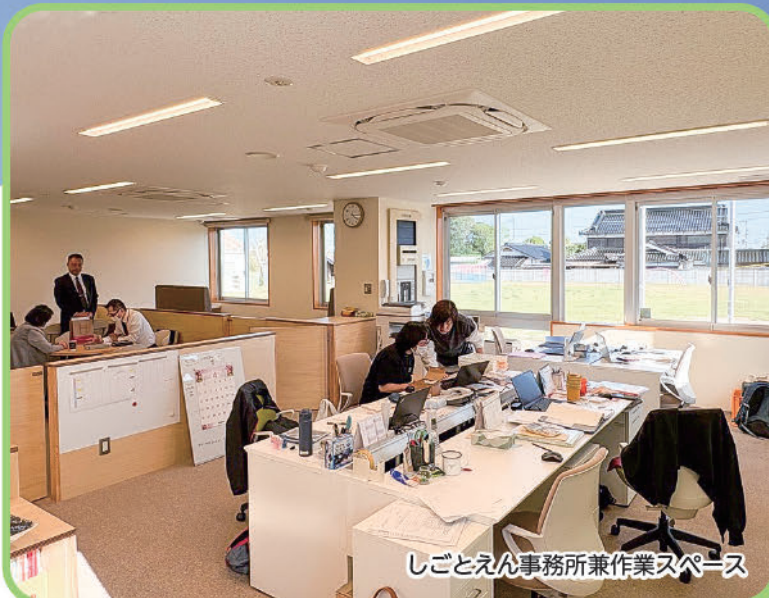
しごとえん事務所兼作業スペース