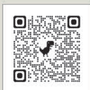
空き家情報バンク