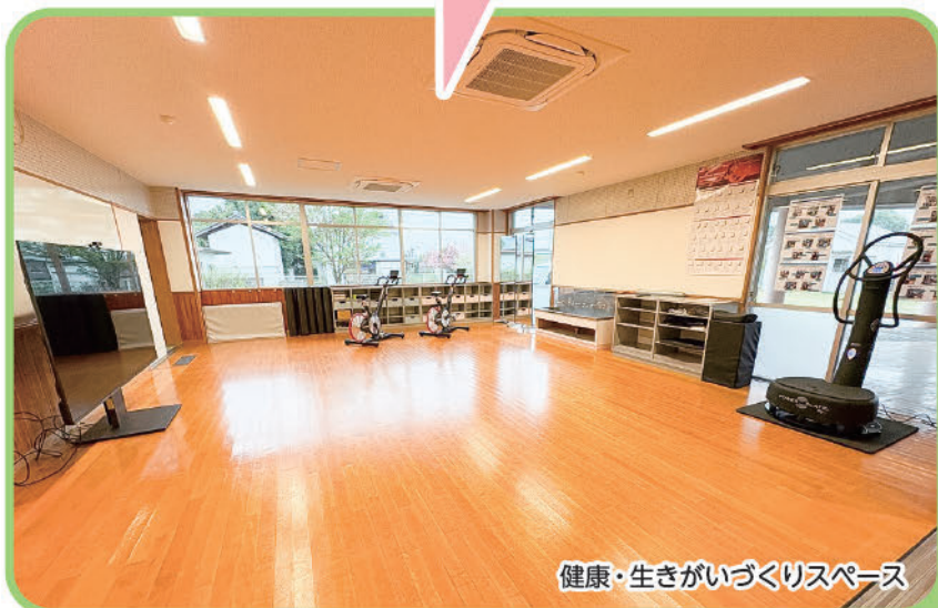
健康・生きがいづくりスペース