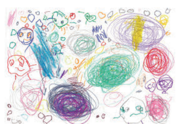
38. 「人がいっぱいいる未来」 (2才)