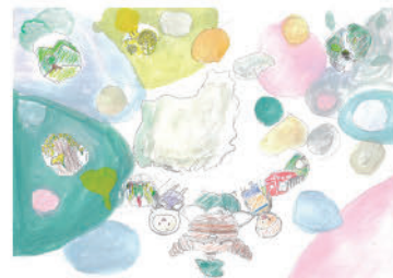
17. みんなの色と私の町 (小学校6年生)