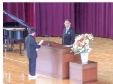
新入生代表 誓いのこたば

多くの保護者や来賓の方々に見守られ、厳粛かつ温かい雰囲気の中、新入生たちはそれぞれの思いを胸に、新たな学び舎での第一歩を踏み出しました。