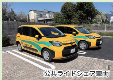
公共ライドシェア車両