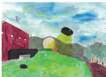
1. そうじロボットで町をきれいに (中学校1年生)

2月1日に奈義町SDGsのつどいを開催し「わたしと奈義町の未来」をテーマとした作文・絵画コンクールの表彰をしました。今月から2回に分けて子どもたちの作品を紹介します。