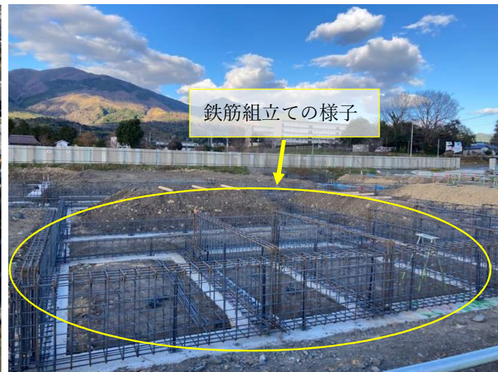
基礎の鉄筋組立ての様子(2歳児棟)