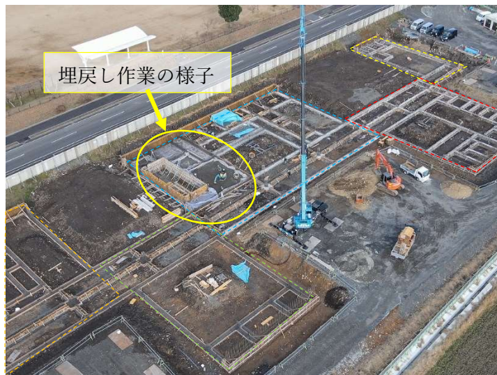
こども園南西側より撮影