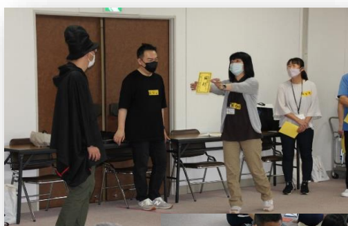
⇐ アンチ大魔王に好きな動物の良さを伝える先生

この研修では、自分の考えだけでなく、相手の気持ちに寄り添い、受け入れて認め、お互いに高め合う力を養うことを目的として、『 アンチ大魔王 』という演劇を取り入れたグループ討論をしました。全てのことに否定的なアンチ大魔王に、肯定的な気持ちを芽生えさせ前向きにさせるにはどうすればよいのか話し合いました。 意見の違いを受け入れながら自分たちの意見を伝えることの難しさを体験しました。 思考力や想像力、そして協働する力の大切さを学ぶ内容でした。