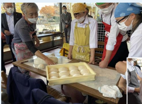
▲焼く前のピッツァの生地はふっくらしてとても柔らかい！