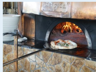
▲ナポリから取り寄せた石窯で一気に焼き上げます