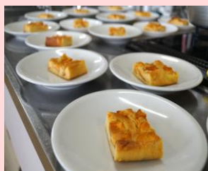
▲デザートは柿を使ったトルタというケーキでした

題材となる料理には、町内の生産者の方に提供していただいた白ネギの他にも、ほぼ奈義町産のものを使い、前菜・主菜・ドルチェの、見た目も鮮やかなコース料理を用意していただきました。テーブルマナーと同時に町の食材のおいしさを知り、ふるさと奈義の良さを実感する事業になったと思います。