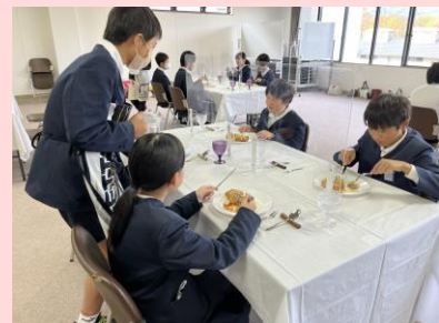
▲緊張しながらもお水を汲みます