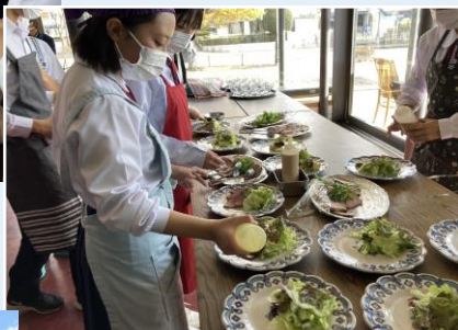
▼1組は盛付も行いました