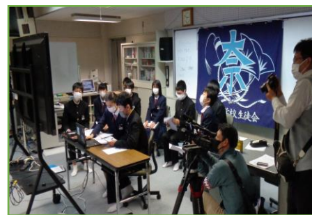
▲奈義中学校でのサミットの様子が NHKで紹介されました

管内15校の中学生がオンラインで参加し、グループに分かれ、メディアを適切に使用するための取組を発表しました。奈義中学校の生徒会は、PTAと話し合い、スマホを適切に使うためには規則正しい生活や家庭内でのルール作りが必要だと確認したこと、広報紙を通じて「学習時間とのメリハリをつけてスマホを使おう」と呼びかけたことなどを発表しました。ほかの生徒らも各教室で他校の生徒の発表を視聴し、意見や感想を共有しました。