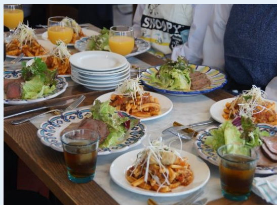
▲里芋と白ネギがパスタと相性抜群でした