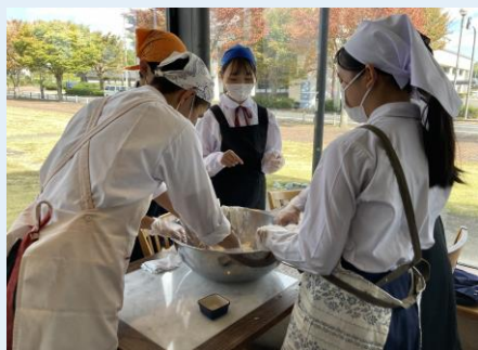
▲昔の人は1時間以上かけてこねていたそうです

町内産の食材について生産から流通、加工までの過程を知り、郷土愛を醸成するとともに、その食材の良さを引き出すための調理法等を学ぶことを目的に、小中学校で地方創生推進交付金事業「学校教育食体験事業」を開催しました。生産者の方にもご参加いただきお話を聞くことができました。本事業にご協力くださった皆様、ありがとうございました。