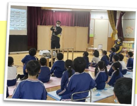
▲ 一枚一枚の紙を順番に見ると… 静止画が動く仕組みに大興奮！

映画鑑賞教育には、 メディアを主体的に読み解く (メディアリテラシー)能力、国や時代など映画の背景を知り、 国や時代による考え方の違い 、 文化や民族を理解すること 、その他 公共性を養う など、多くの効果を期待しています。年代もジャンルも多様な映画を、高品質な文化体験と位置づけ、取り組んでいきたいと考えています。