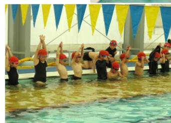
▲職場体験の中学生も一緒に遊んでくれました