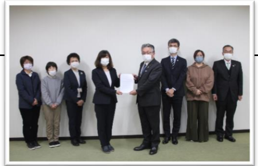
▲ 集中審議をいただいた検討委員の皆さんから答申を受けました

再来年、令和6年4月の開園を目指して、こども園・中学校建設推進室が建築に向けた詳細設計を進めていますが、教育委員会では、こども園での教育や保育にあたっての理念や方針の策定を行ってきました。今回は、この内容などについてご紹介します！