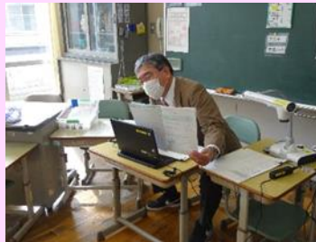
実物投影機で分かりやすさにも配慮 ▶