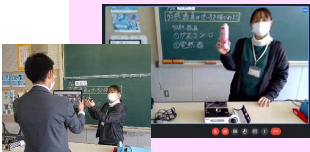
▲ チームワークで、テレビ番組のような授業配信