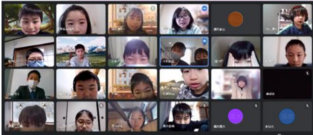
▲ たくさんの子どもたちとつながることができました