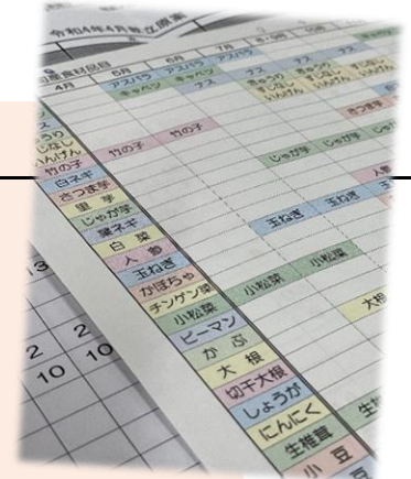
▲ 奈義で採れる品目数にびっくり！

奈義町には、季節ごとの気候に合わせて育つ たくさんの優れた食材 があります。春には、「たけのこ、小松菜、しいたけ、アスパラガス、キャベツ、玉ねぎ、大根、わらび、ほうれんそう…」。旬の食材は、 美味しいのはもちろんのこと、栄養価も高く、安価 で手に入ることもうれしいですね。学校給食では、これまでも町内で採れる豊かな食材を活用してきましたが、あらためて 収穫期を意識して献立に反映 しようと、「給食献立検討会」を行いました。