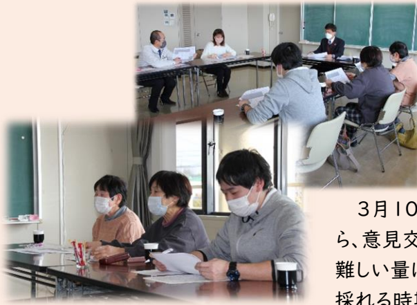
▲ 日頃のちょっとした情報交換で使える食材がまだまだありそうです

1月25日、学校や給食センター、教育委員会職員に加え、「なぎ高原 山彩村」の代表の方々、「晴れの国 岡山農協」の奈義支店長にお越しいただき、この取り組みについて共有し、今後の進め方を協議しました。その後、奈義町で採れる「 食材品目 」と「 収穫期 」を生産者から提示していただき、給食センターにて活用食材と献立の検討を行いました。