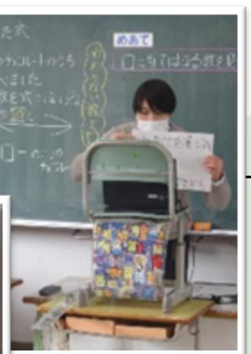
◀◀ 画面の向こうの児童達に一生懸命伝えます

閉鎖とした期間中、小学校3年生以上の学年では 授業をリモートで配信 したり、中学校では 健康状態の報告 を受けるなど、GIGAスクール環境の有効活用に取り組みました。少しでも分かりやすく伝えようと、それぞれの現場で 試行錯誤 が見られました。リモート活用の裏側をお伝えします！