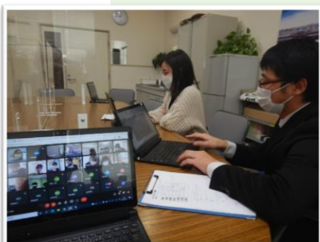
◀ 生徒達の顔を見ながらの朝の会

閉鎖とした期間中、小学校3年生以上の学年では 授業をリモートで配信 したり、中学校では 健康状態の報告 を受けるなど、GIGAスクール環境の有効活用に取り組みました。少しでも分かりやすく伝えようと、それぞれの現場で 試行錯誤 が見られました。リモート活用の裏側をお伝えします！