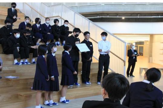
階段はステージとしても利用できます

12月10日(日)には奈義町SDGs円卓会議が今年も開催されます。SDGsの17のゴールの一つ「住み続けられるまちづくり」の実現に向け、子育てや教育の大切さを全国に発信します。👉