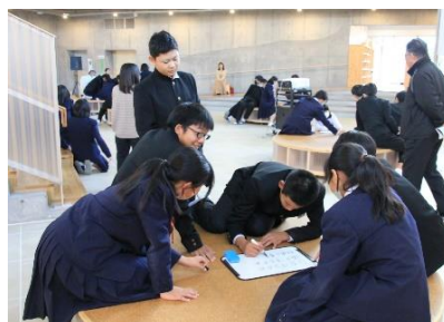
ベンチを活用して意見をまとめる生徒たち