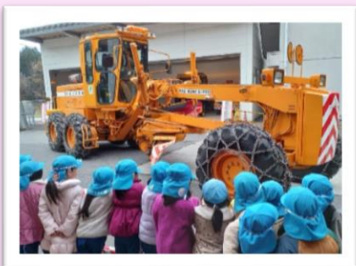
←路面の雪や氷を削り取る除雪グレーダ