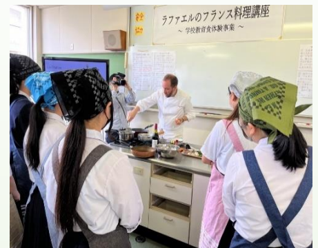
▲7/6(3年1組)には取材も来ました

日本人の私たちにも合うように多少アレンジをしながら、フレンチの盛り付けも学びおしゃれな料理ができました。食べ慣れないスパイスに苦戦する生徒たちもいましたが、普段とは違った味付けに美味しいとの感想が多く見られました。