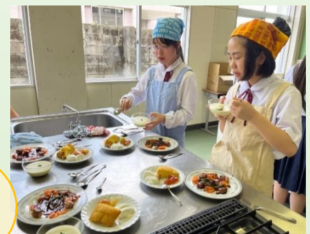
▲初めての味に戸惑い・・・?

調理後は、簡単なフランス語やテーブルマナーなどを教わりました。日本とは随分異なる食文化に驚きつつも、フランスに由来するものが案外身近にあることを知り、みんな興味津々な様子でした。郷土への理解を深めると同時に、国際的な視野が広がるきっかけにもなったと思います。