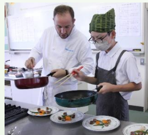
▲フランス定番のワイン仕立てのソースです

調理メニューはブルギニオンソース(なぎビーフのステーキにかけました)、ヴィシソワーズ(じゃがいもと白ネギのスープ)、ホイップクリームで、町内産の食材を活かした本場の調理法を教えてくださいました。