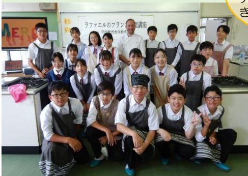
▼2年1組の生徒の皆さんと