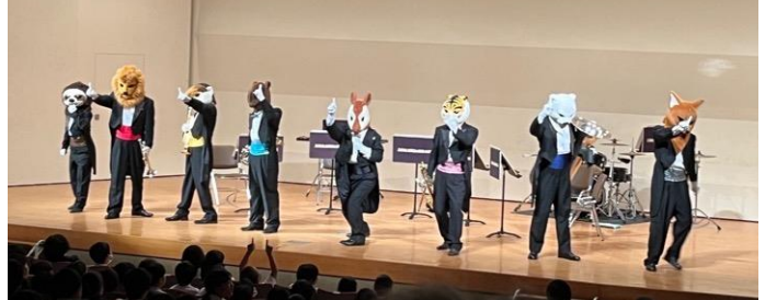
▲左から、ナマケモノ（パーカッション）、インドライオン（トランペット）、ドックラングール（トランペット）、マレーバク（ホルン）、オカビ（指揮）、スマトラトラ（トロンボーン）、ホッキョクグマ（チューバ）、ドール（ドラム・パーカッション）

低学年向けのポップな演奏と、演奏者が客席から登場する演出で子どもたちは大興奮。みんな歓声をあげながらノリノリで音楽を楽しんでいました。