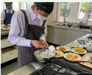
▲ホイップクリームの盛り付けは難しい...

日本人の私たちにも合うように多少アレンジをしながら、フレンチの盛り付けも学びおしゃれな料理ができました。食べ慣れないスパイスに苦戦する生徒たちもいましたが、普段とは違った味付けに美味しいとの感想が多く見られました。