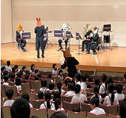
▲後ろから登場したドールにみんなびっくり！

6月27日に幼稚園、小・中学校の合同芸術鑑賞会として、「ズーラシアンブラス」による演奏会（音楽の絵本）が開催されました。ズーラシアンブラスは希少動物たちによって結成された金管五重奏の楽団で、この日はドラムとパーカッションの2匹が加わった金管打楽器七重奏で、クラシックからラテン音楽、ジブリメロデーなどが演奏されました。演奏会は2部構成で一般の方も入場でき、第1公演では幼稚園児から小学4年生が鑑賞しました。