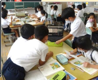
▲▶ 板書や練習風景、グループワークなど様々な場面で活用が見られました。

「音が聞き取りにくい」「充電ができなかった」など、 課題もありましたが 、ご協力いただいた保護者の方からは「一人で自主学習するよりもみんなとすることで 一体感があった 」「運動会の練習に参加できないことが 不安 だったが、 練習の様子が見られてよかった 」など、感想がありました。