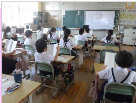
▲ 国語の授業。範読や追い読みなど、いつもの先生の授業をリモートで受けました。

在宅勤務になった担任の先生が、自宅からの “逆リモート授業” に挑戦。朝の会では、児童たちが各自のタブレットでGoogleのMeetにログインして、 一人ひとりの顔を見ながらの健康観察チェック をしました。国語の授業では、デジタル教科書を画面共有しながらの音読、算数の授業では、画面に問題を次々と表示させるフラッシュ型教材やデジタル教科書などを活用しながら、 双方向の活動 を行うことができました。帰りの会では、「リモートの授業はおもしろかった」「先生がいなくても自分たちで頑張れた」など、前向きな意見が多く聞かれたそうです。